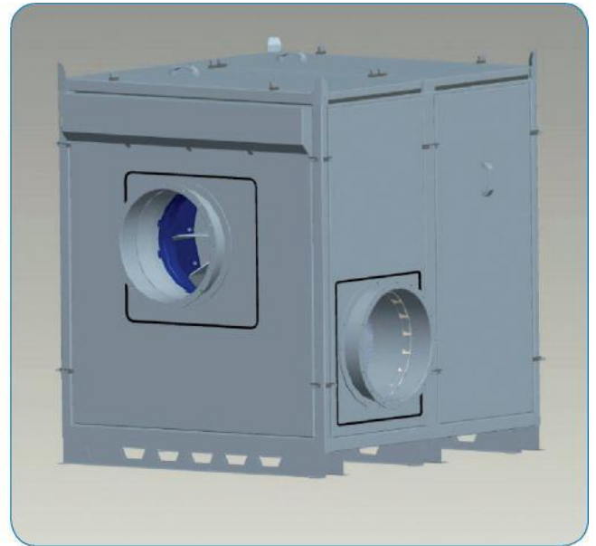
Der Ventilator kann von allen 4 Seiten der Haube aus gewartet werden.