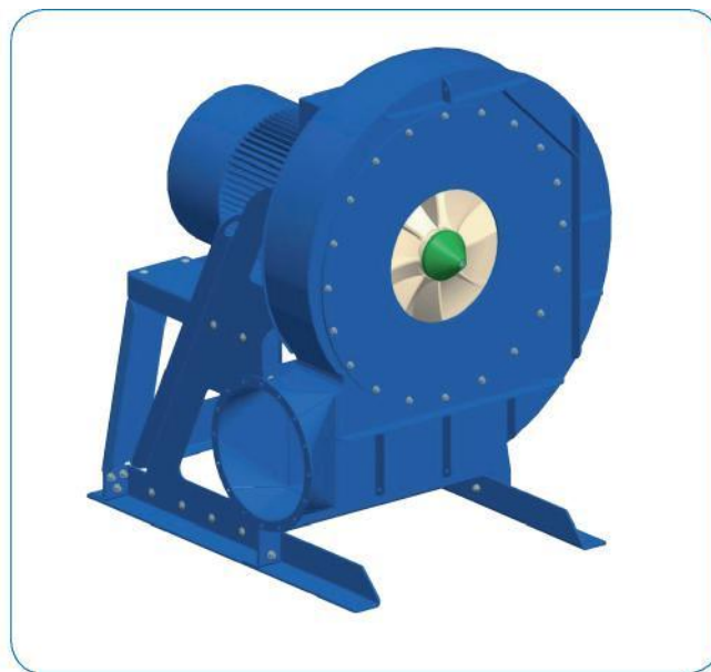
Direkt gekuppelter T-Ventilator